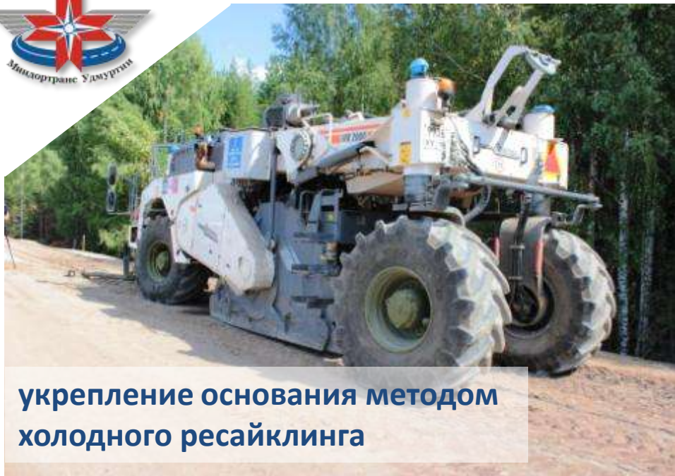
укрепление основания методом холодного ресайклинга