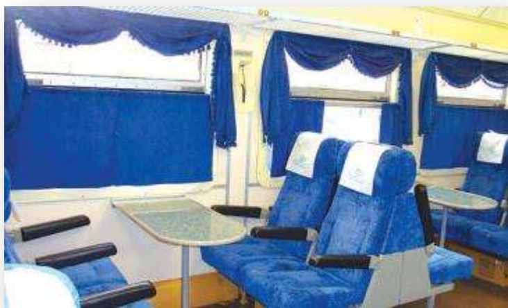
Комфортный вагон, бесплатный Wi-Fi в поездах