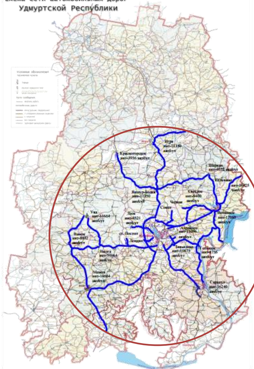
Схема сети автомобильных дорог Удмуртской Республики