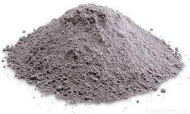
Модификаторы «Дорцем», «Нокофлок», «Наностаб»