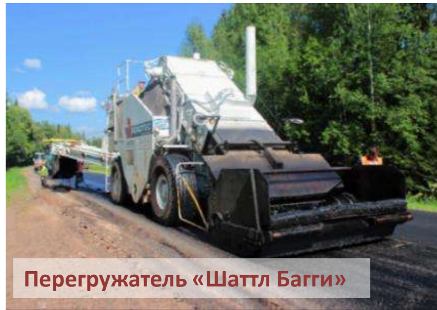
Перегружатель «Шаттл Багги»