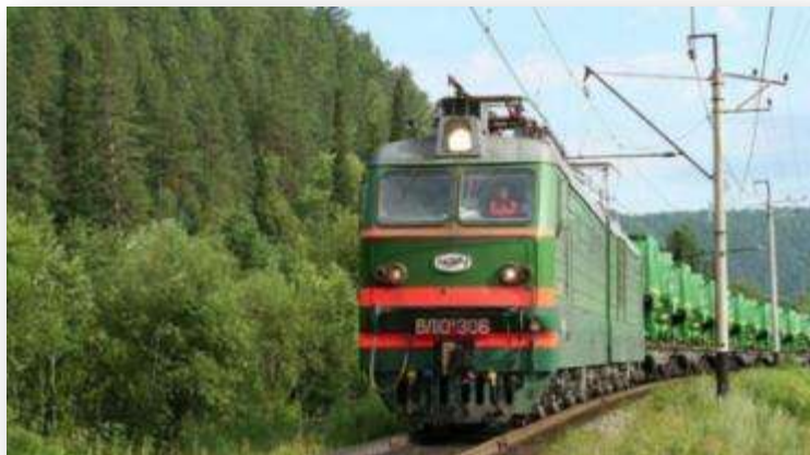
ОАО «ВВППК» приобрело в лизинг железнодорожный подвижной состав